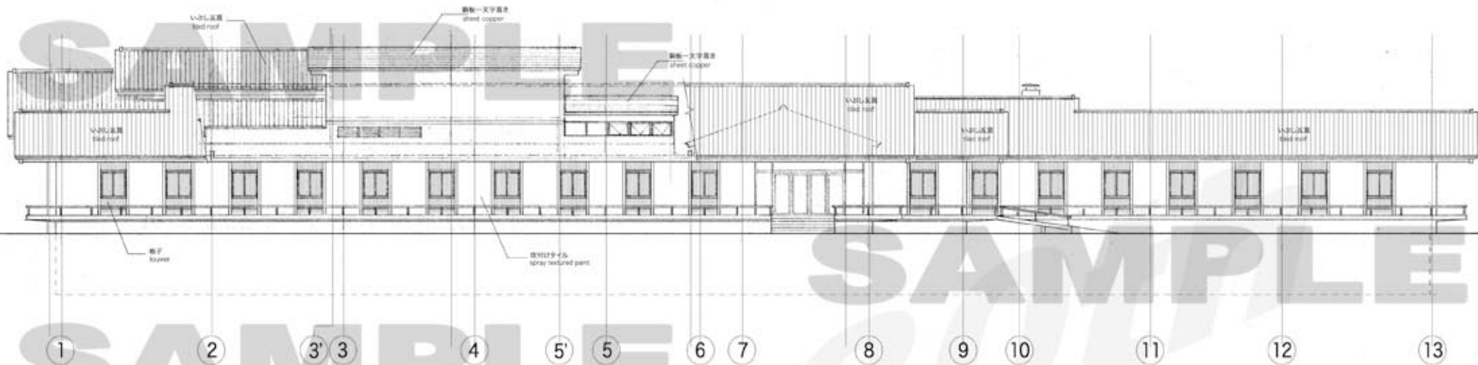
南側立面図 South Elevation